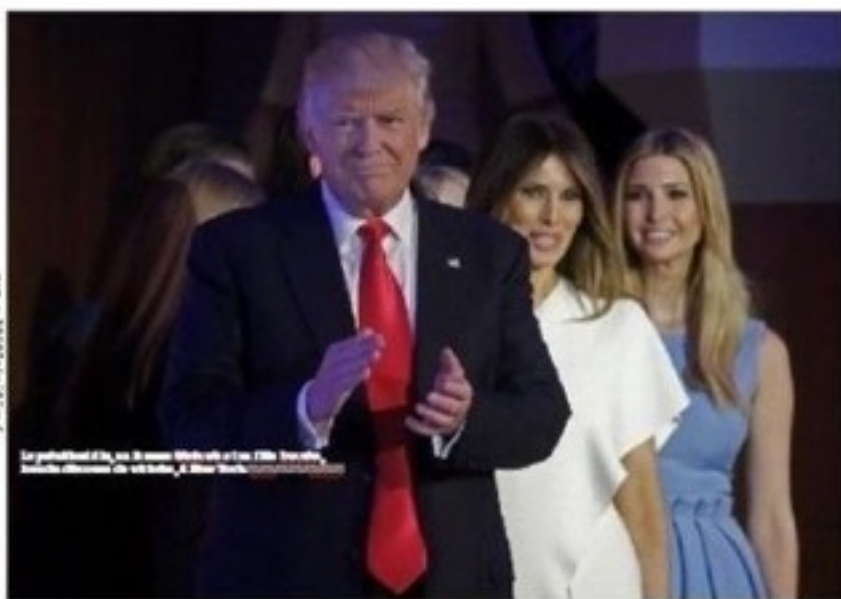
Le président élu, sa femme Melania et sa fille Ivanka Trump, à la Maison-Blanche, le 20 janvier 2017.